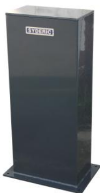
Option socle renforcé anti-vibrations- Réf.:PS1